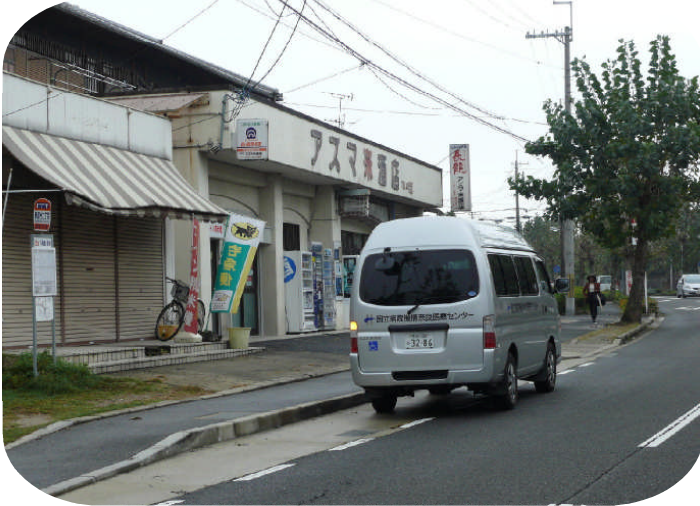
※ 青垣台2丁目バス停付近