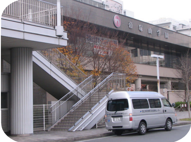
※ 帝塚山学園前の歩道橋階段付近